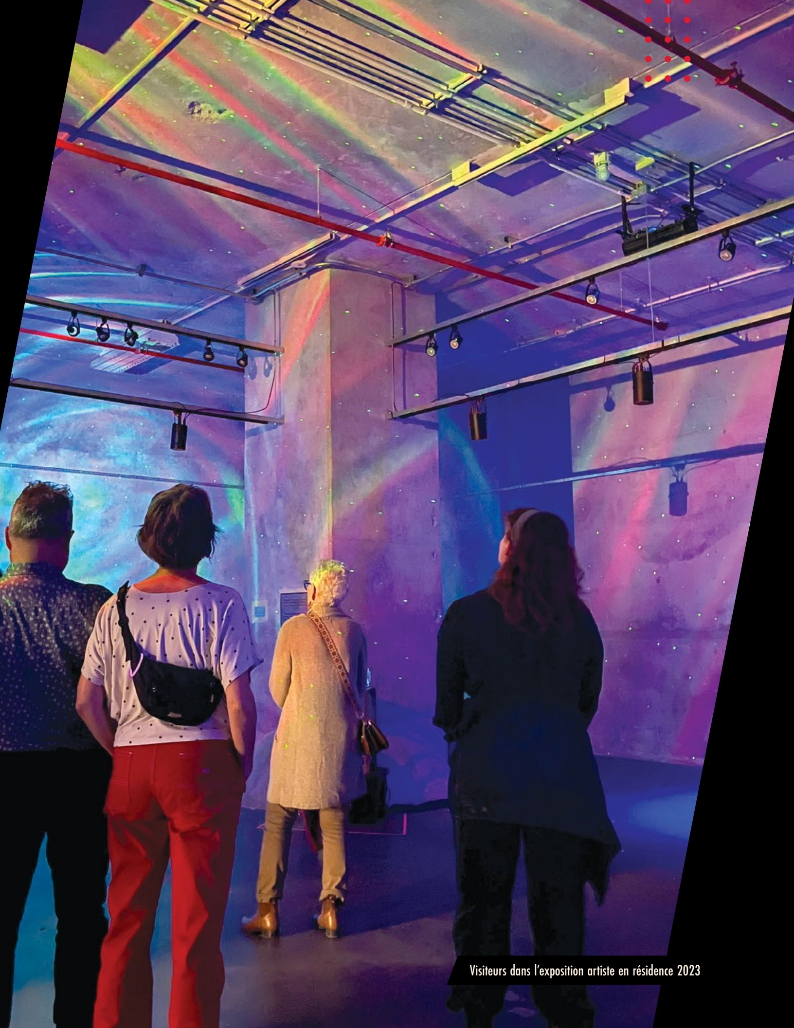
Visiteurs dans l'exposition artiste en résidence 2023