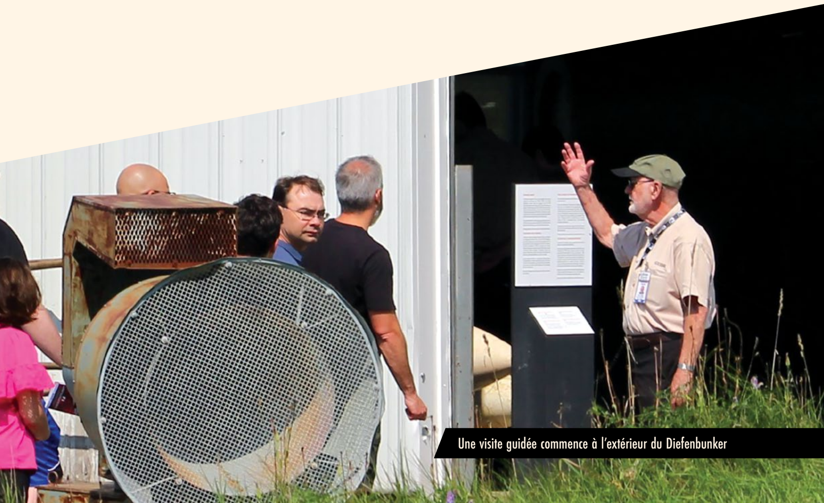
Une visite guidée commence à l'extérieur du Diefenbunker