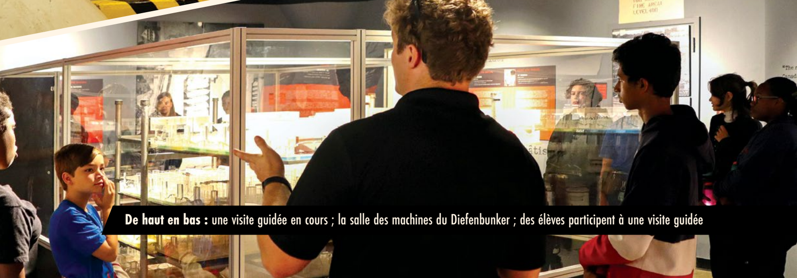
De haut en bas : une visite guidée en cours ; la salle des machines du Diefenbunker ; des élèves participent à une visite guidée