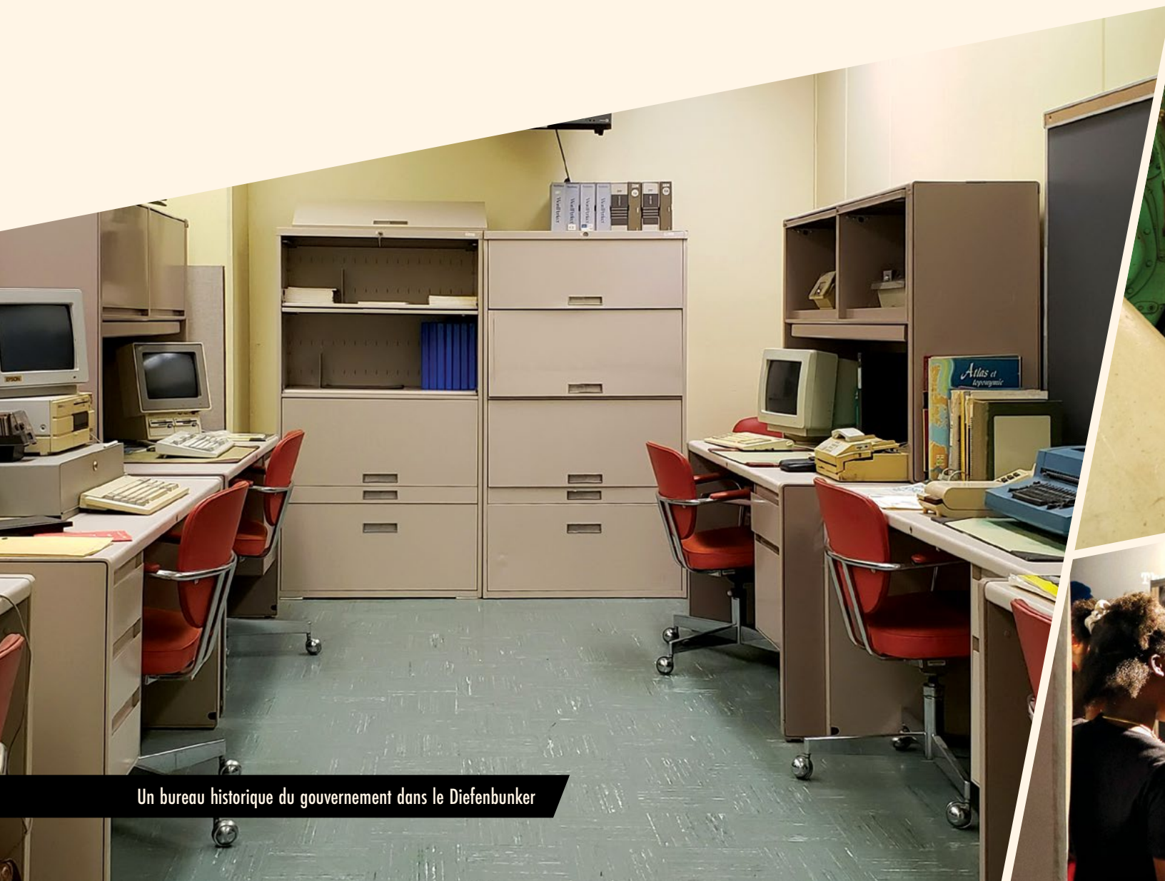
Un bureau historique du gouvernement dans le Diefenbunker