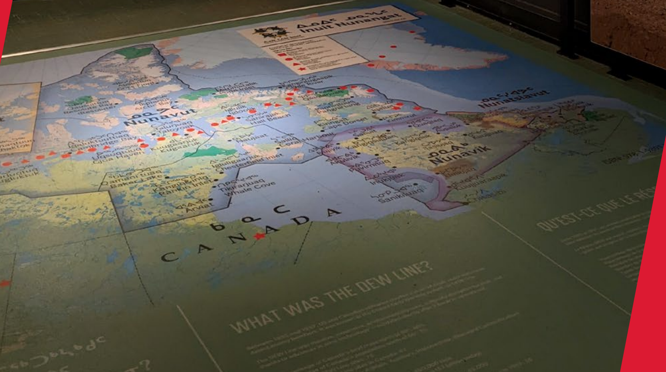
Une histoire inuite – Le Réseau DEW Exposition permanente ouvert en mars 2023

Informational panel with text in Inuktitut and English.